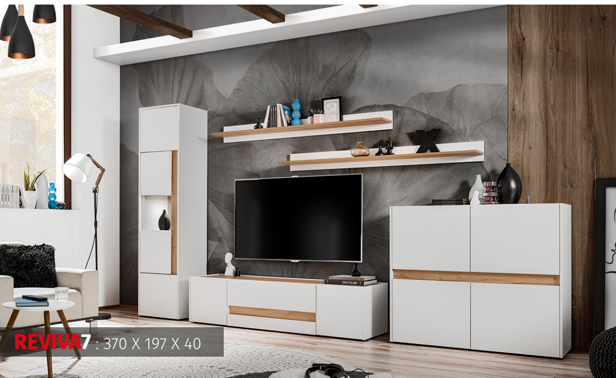
REVIVA7 : 370 X 197 X 40