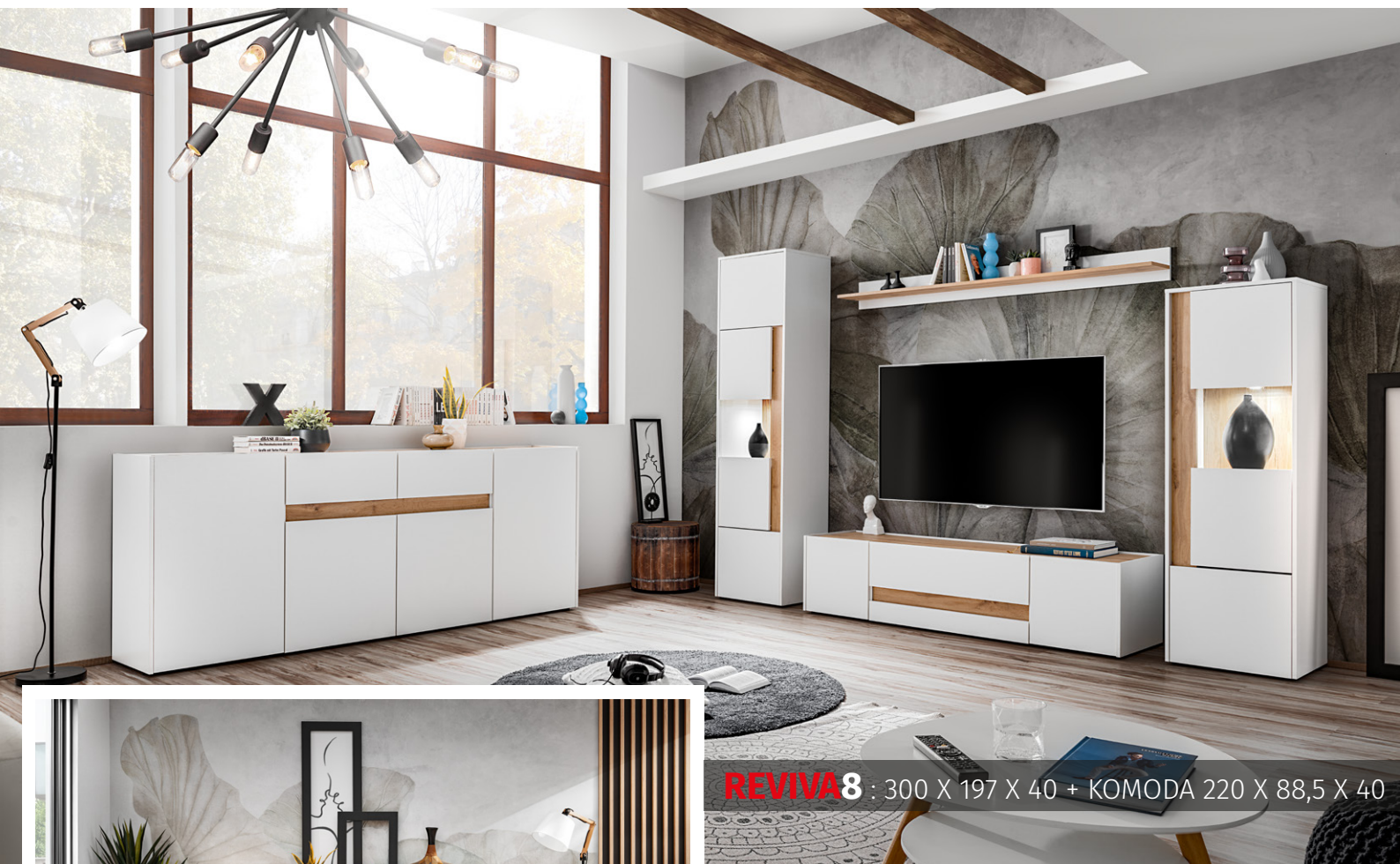
REVIVA8 : 300 X 197 X 40 + KOMODA 220 X 88,5 X 40